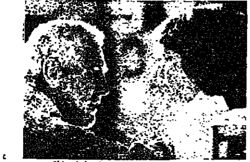
سلي فيلد، و بول نيومان، في «غياب الملك»